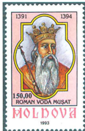
Sello de Moldavia emitido en 1993 que pertenece a una serie dedicada a los príncipes moldavos.

Los países bálticos (Estonia, Letonia y Lituania) junto con Moldavia fueron los pioneros en realizar nuevas