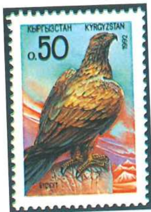
Kirguizistán dedicó su primer sello, emitido en 1992, al águila.

ecológicos; Tadzikistán, que imprimió su nombre en diferentes caracteres sobre motivos alegóricos a su historia milenaria; y Turkmenistán, que optó por dar protagonismo a su fauna y flora, así como a su folklore y tradiciones.