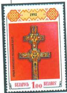
A la izquierda, una cruz del siglo XII fue la protagonista de la tercera emisión de Bielorrusia, realizada en 1992. A la derecha, medios de transporte antiguos y modernos ilustran la tercera emisión de Kazajistán (1992).

Por el contrario, Bielorrusia carecía de antecedentes históricos previos a sus primeras emisiones de 1992. En estos sellos el nombre del país aparece en caracteres cirílicos y latinos. También carecían de tradición filatélica una serie de países que emprendieron sus emisiones en 1992: Kazajistán, que las inició con el «soldado de oro»; Kirguizistán, que dedicó sus primeros sellos a temas