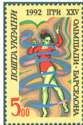
Emisión de Ucrania realizada en 1992 con motivo de los Juegos Olímpicos de Barcelona.

emisiones, iniciándolas en 1991. Sus primeros sellos estuvieron dedicados a los símbolos nacionales (como el escudo o la bandera). Ucrania, que como República Popular contó con innumerables emisiones entre 1919 y 1920, debe sumarse a estos países, ya que también reinició sus emisiones en 1991. Éstas destacan por estar dedicadas sobre todo a temas culturales: música, literatura, pintura, arquitectura, etc.