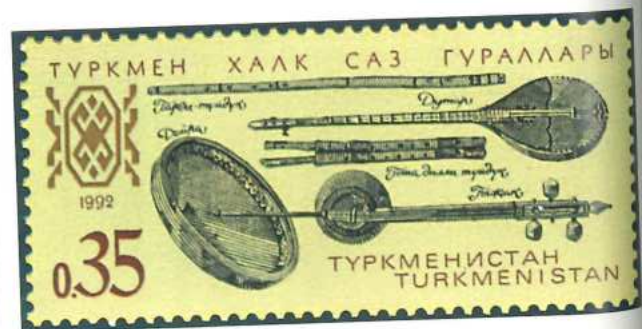
Segunda emisión realizada por Turkmenistán (1992), que estuvo dedicada a diversos instrumentos de la música folklórica nacional.

La característica principal de las nuevas emisiones fue la desaparición de los símbolos políticos que ilustraban los sellos de la antigua URSS y la recuperación de otros antiguos (como la famosa águila bicéfala), así como la inclusión del nombre oficial del Estado en caracteres cirílicos y latinos. Por otra parte, en 1992 se emitieron por primera vez sellos dedicados a la Navidad, con cuatro efectos reproduciendo antiguos iconos con escenas del Nacimiento de Jesús. También se dedicaron varias emisiones a los personajes históricos de la Rusia zarista.